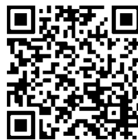
jhousechannel の Youtube