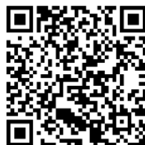
LINE の QR

〒530-0047 大阪市北区西天満 5-11-9 TEL 06-4709-7040 FAX 06-4709-7041 ホームページ http://www.jhouse.tv E-mail office@jhouse.tv