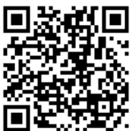
結婚式のライブ配信